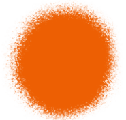
Orange Edible Color Spray 1.5 oz - 42g