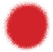
Red Edible Color Spray 1.5 oz - 42g