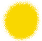
Yellow Edible Color Spray 1.5 oz - 42g