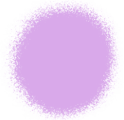
Violet Edible Color Spray 1.5 oz - 42g