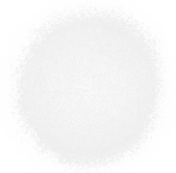
Pearl Edible Color Spray 1.5 oz - 42g