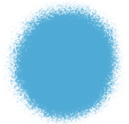
Blue Edible Color Spray 1.5 oz - 42g