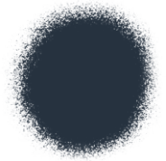
Black Edible Color Spray 1.5 oz - 42g