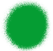
Green Edible Color Spray 1.5 oz - 42g