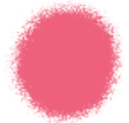
Pink Edible Color Spray 1.5 oz - 42g