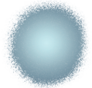
Silver Edible Color Spray 1.5 oz - 42g